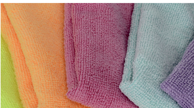
Abbildung 1: Mikrofasertücher