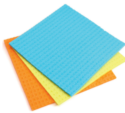
Abbildung 5: Schwammtücher