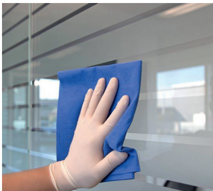
Abbildung 4: Tuch mit der flachen Hand führen