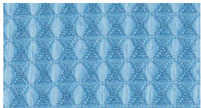
Abbildung 2: Mikrofasertuch vergrößert